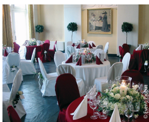
Terrassensaal 100 qm