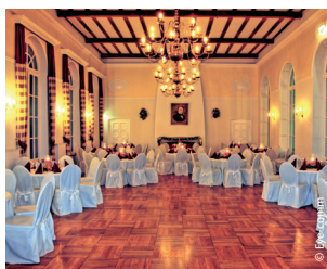
Ballsaal 160 qm